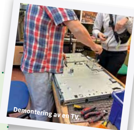
Demontering av en TV.

Vill du läsa mer om MO GÅRDS dagliga verksamheter kan du göra det på: www.mogard.se/daglig-verksamhet/